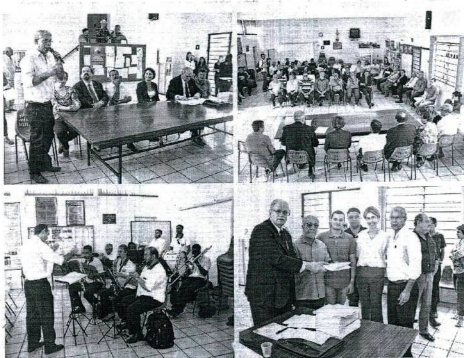
Encaminhamento conclusivo dos trabalhos foi marcado por apresentação da banda ferroviária União dos Artistas

formou haver estado no dia anterior com o secretário estadual de Transportes Metropolitanos Clodoaldo Pelissioni. Segundo Demarchi, o secretário acompanha a mobilização de Rio Claro e se dispôs a agendar a entrega do abaixo-assinado ao governador Geraldo Alckmin.