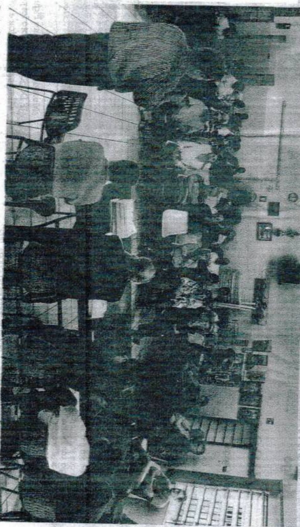
Cerimônia para encerramento da campanha pelo retorno do trem, foi realizada nessa quinta-feira (16) na sede da UFA Local